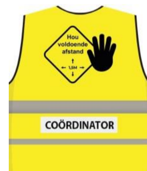
Volg de aanwijzingen op