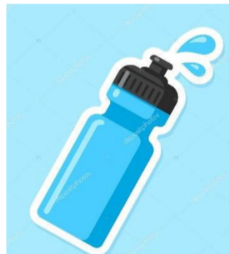
Thuis bidon vullen