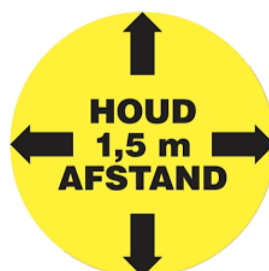
Houdt zo veel mogelijk 1,5 meter afstand

Alleen samen krijgen we corona onder controle !!