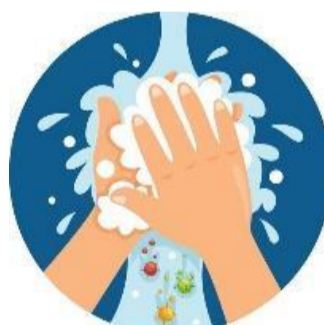
Handen wassen bij de ingang